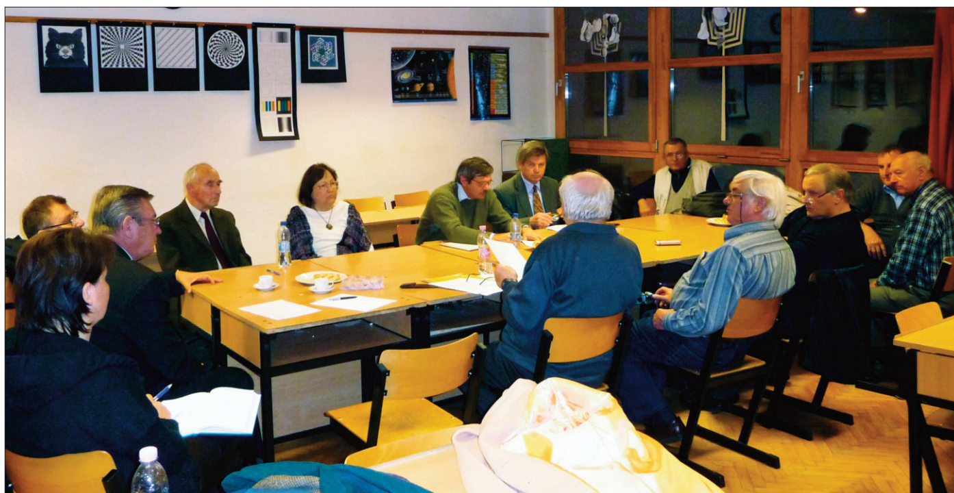
BBK Elnökségi ülés 2014. október 31-én