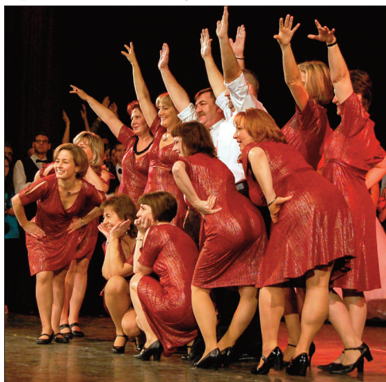
Tanárok tánca a szalagavatóon