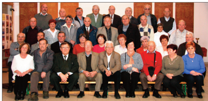
Nyugdíjas találkozó – 2014. február 28.

- 2015. május 30-án (szombaton) pedig az 50 éve 1965-ben végzett diákjainknak szervezzük meg az évfolyam találkozót.