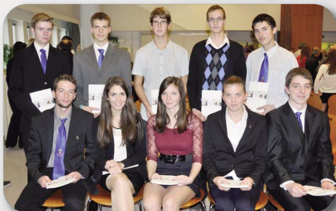
Idei DDC ösztöndíjasaink