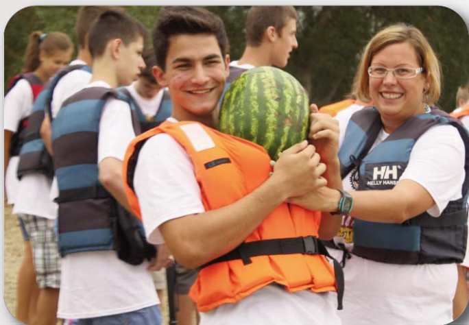
Gólyatábor extrém feladattal

A BORONKAYS DIÁKOK 1985-BEN ALAPÍTOTT ÚJSÁGJA