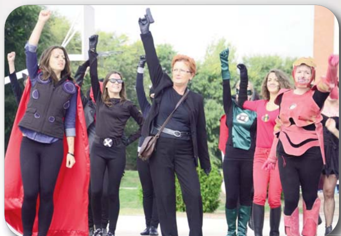
Az iskolát megmentő szecskák