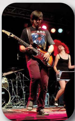
House of Grooves – 4.