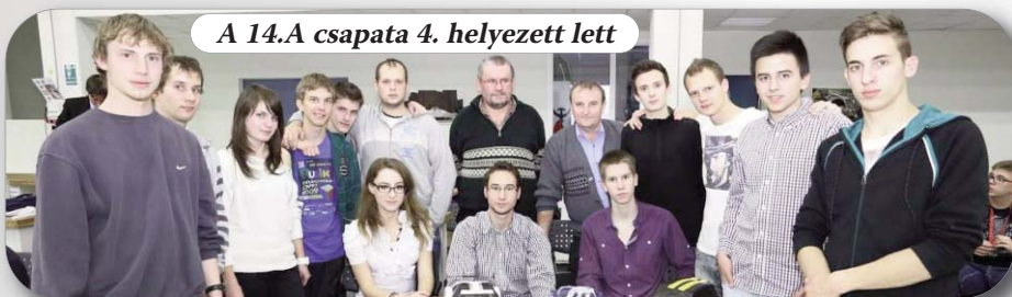
A 14.A csapata 4. helyezett lett