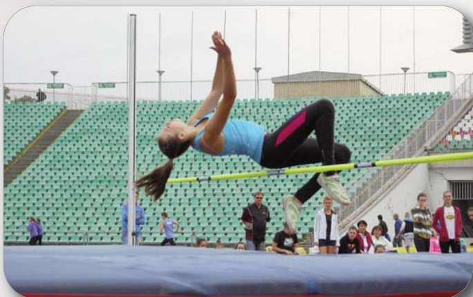
Diákolimpiai számokban újra az élen