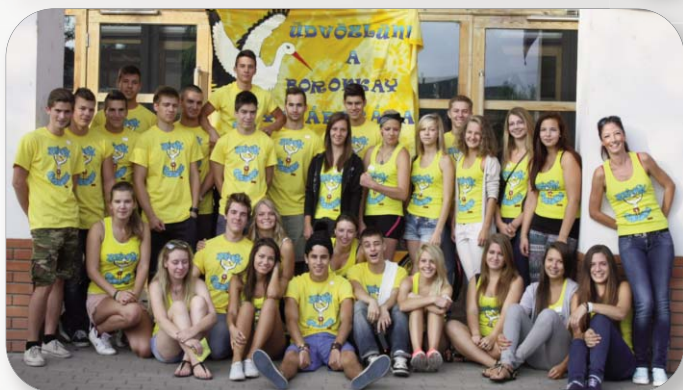
A 2013-2014. tanév dökös csapata