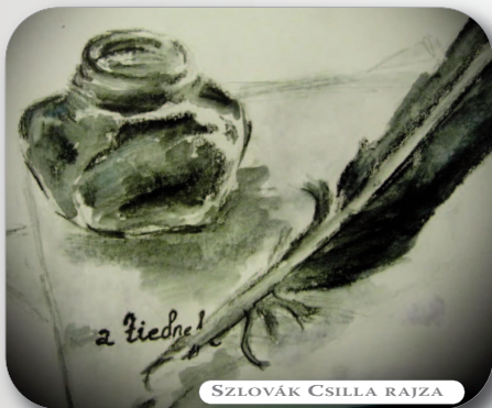
SZLOVÁK CSILLA RAJZA