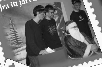
Újra itti járt a Mikulás!