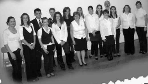
Az október 23-i ünnepi műsort a 11.G adta