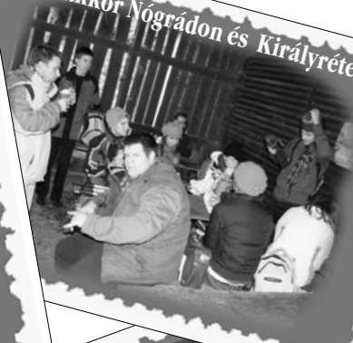
Fotószakkör Nógrádon és Királyréten járt