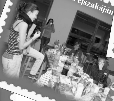
A francia filmek éjszakáján