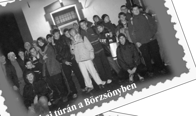
Éjszakai túrán a Börzsönyben