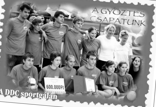
A DDC sportgálán 600.000Ft